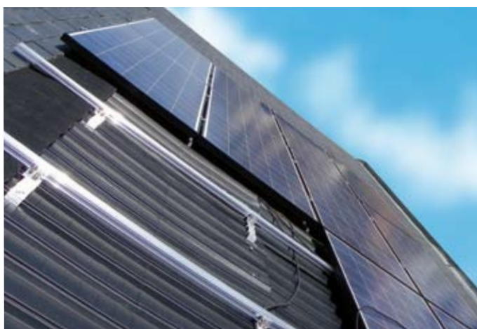
Système d'intégration en rouleau, l'IR 40